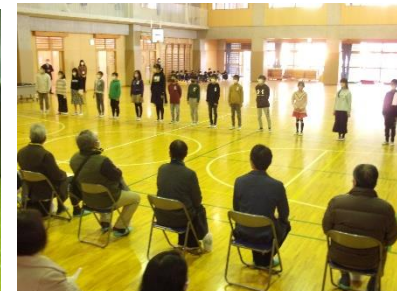
5年生 English Song 「Thank you Song for kids」