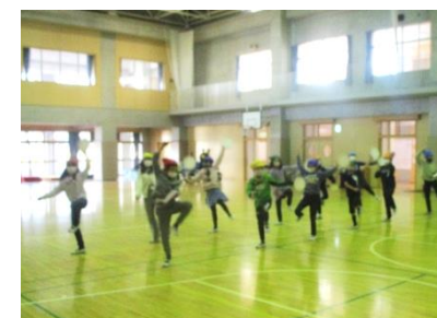
4年生 ダンス「エイサー」