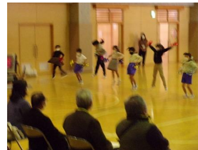
1年生 ダンス「ことばのうた」