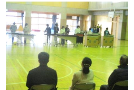
6年生 合奏「ラヴァース コンチェルト」