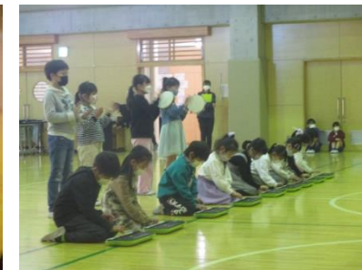
2年生 合奏「山のポルカ」